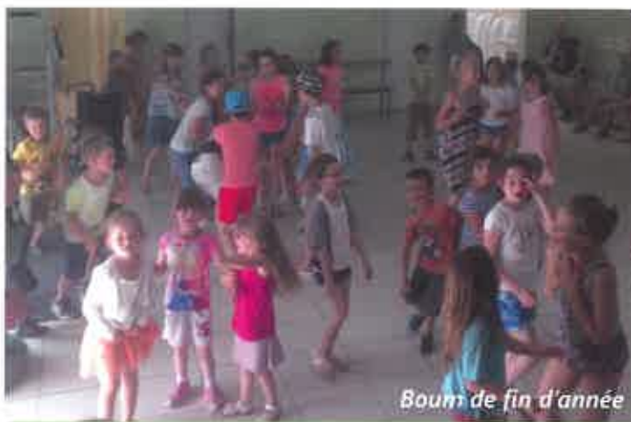
Boum de fin d'année

Comme vous avez pu le constater des travaux ont été réalisés dans notre école. Pour améliorer le confort et la sécurité de nos enfants, nous avons modifié des portes anti-intrusion afin qu'elles répondent aux normes, une nouvelle clôture ainsi que des range-vélos. Nous avons également investi dans l'achat d'un nouveau vidéoprojecteur, un ordinateur portable, des tricycles et trotinettes.