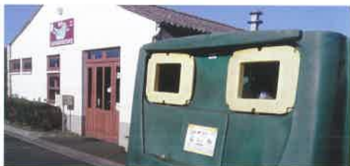
A côté de la boule de fort