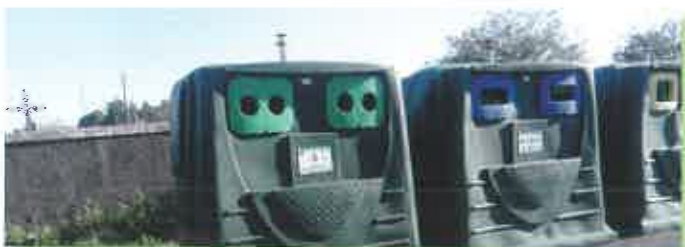
Derrière le cimetière, parking de la bibliothèque

Pour le bien-être de tous, ce qui est trop encombrant doit être déposé à la déchèterie et non en dépôt sauvage autour des points de collecte.