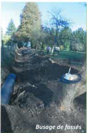
Busage de fossés