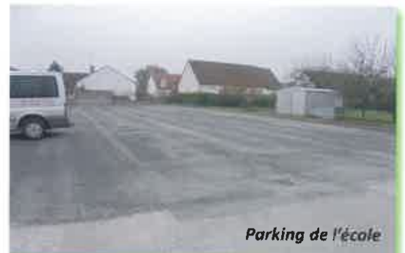
Parking de l'école

Tous les projets et permis de construire sont à déposer en Mairie, lesquels sont transmis par la suite à Pays Loire Nature à Ambillou.