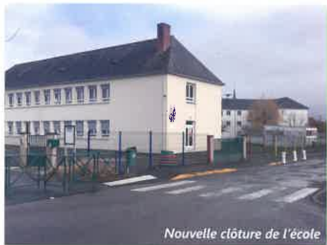
Nouvelle clôture de l'école

Cependant, nous devons au préalable solliciter les autorisations d'urbanisme afin d'obtenir les accords des services compétents (SDIS / service accessibilité).