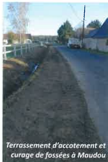
Terrassement d'accotement et curage de fossées à Maudou