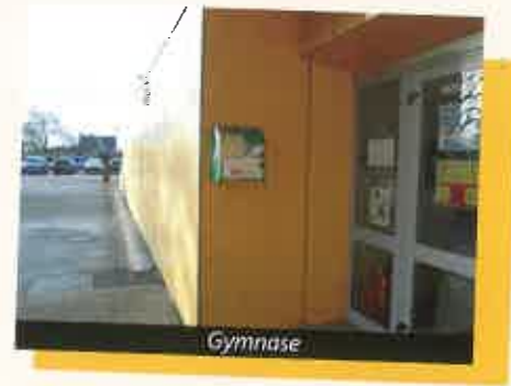
Deux défibrillateurs ont été installés sur la commune.

Depuis le décret de mai 2007, toute personne est autorisée à se servir d'un défibrillateur. Les consignes pour secourir la victime sont indiquées sur l'appareil par des pictogrammes, mais aussi vocalement tout au long de l'intervention.