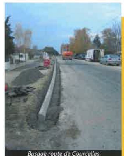
Busage route de Courcelles