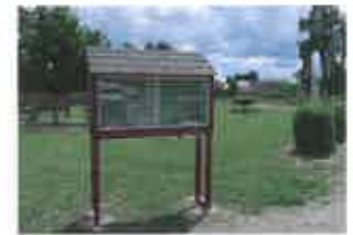
Mise en place d'une boîte à livres en face du relais SEPIA en juin 2018

Le Père Noël a pris un peu d'avance pour équiper la bibliothèque de 2 IPAD qui serviront aux animations numériques (Contes numériques et coloriages en réalité augmentée, tables d'expositions...). Un IPAD est à la disposition des lecteurs pour consulter le catalogue en ligne : https://savigne-lathan.bibli.fr/ Accès gratuit pour les lecteurs à la médiathèque numérique départementale «Nomade médiathèque» : Vidéos, offres de formations, musique, actualités, Touraine et un portail enfants sécurisé : https://nomade.mediatheques.fr/