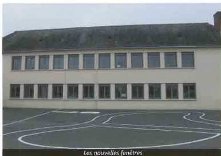
Les nouvelles fenêtres