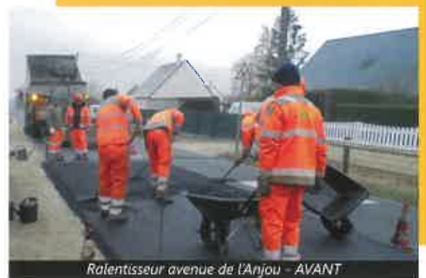
Ralentisseur avenue de l'Anjou - AVANT