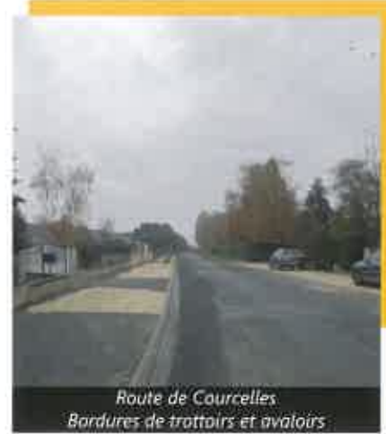
Route de Courcelles Bordures de trottoirs et avaloirs