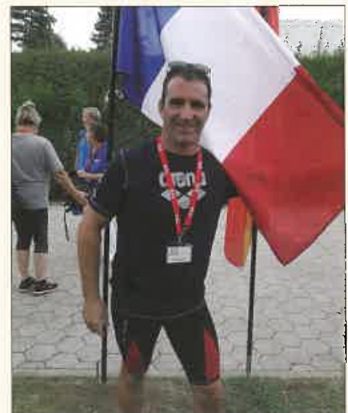
EUROPEAN MASTERS CHAMPIONSHIPS SLOVENIA

Prochain rendez-vous dans 2 ans à BUDAPEST en HONGRIE pour les Championnats d'Europe Masters.