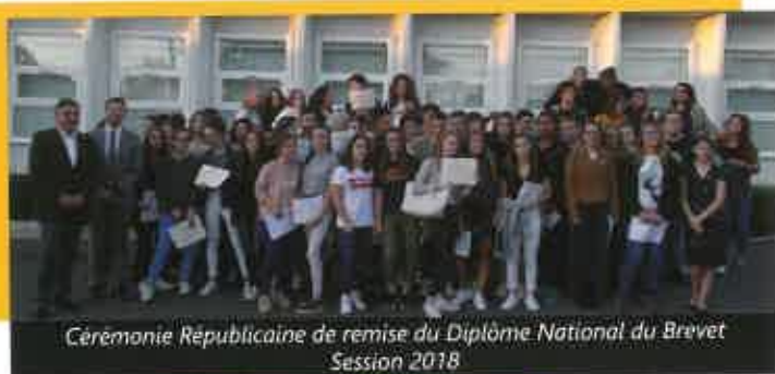
Cérémonie Républicaine de remise du Diplôme National du Brevet Session 2018

tions thématiques (sur l'obsolescence programmée par exemple), une politique volontariste d'approvisionnement de denrées locales et biologiques pour le restaurant scolaire, le tout organisé par un comité de pilotage Agenda 21 et un atelier hebdomadaire comprenant les éco-délégués et divers acteurs internes et partenaires. En juin, le collège a obtenu la labellisation «E3D» : établissement en démarche de développement durable.