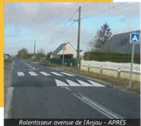
Ralentisseur avenue de l'Anjou - APRES