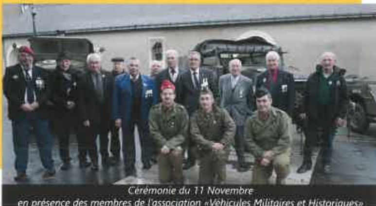
Cérémonie du 11 Novembre en présence des membres de l'association «Véhicules Militaires et Historiques»

L'association compte actuellement 17 adhérents anciens combattants de la guerre d'Algérie et 9 veuves de combattants d'Afrique du Nord C.A.T.M.