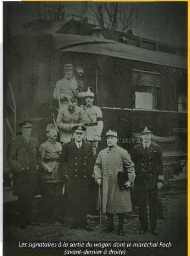
Les signataires à la sortie du wagon dont le maréchal Foch (avant-dernier à droite)