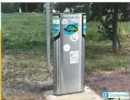
Borne de recharge située au 18, rue de la Gare (en face du Super U).

Pour mieux refléter ses activités, le SIEIL a changé d'identité graphique en 2018. Le nouveau logo traduit bien les notions de maillage, de réseaux et d'interconnexions.