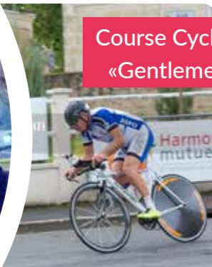
Course Cycliste «Gentlemen»