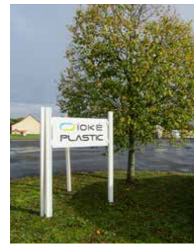
IOKEPLASTIC rejoint le programme BPI Accélérateur Plasturgie et Composites

Ioképlastic est spécialisée dans l'injection plastique, de la conception à la production en série et au conditionnement.