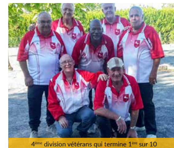
4 ème division vétérans qui termine 1 ère sur 10