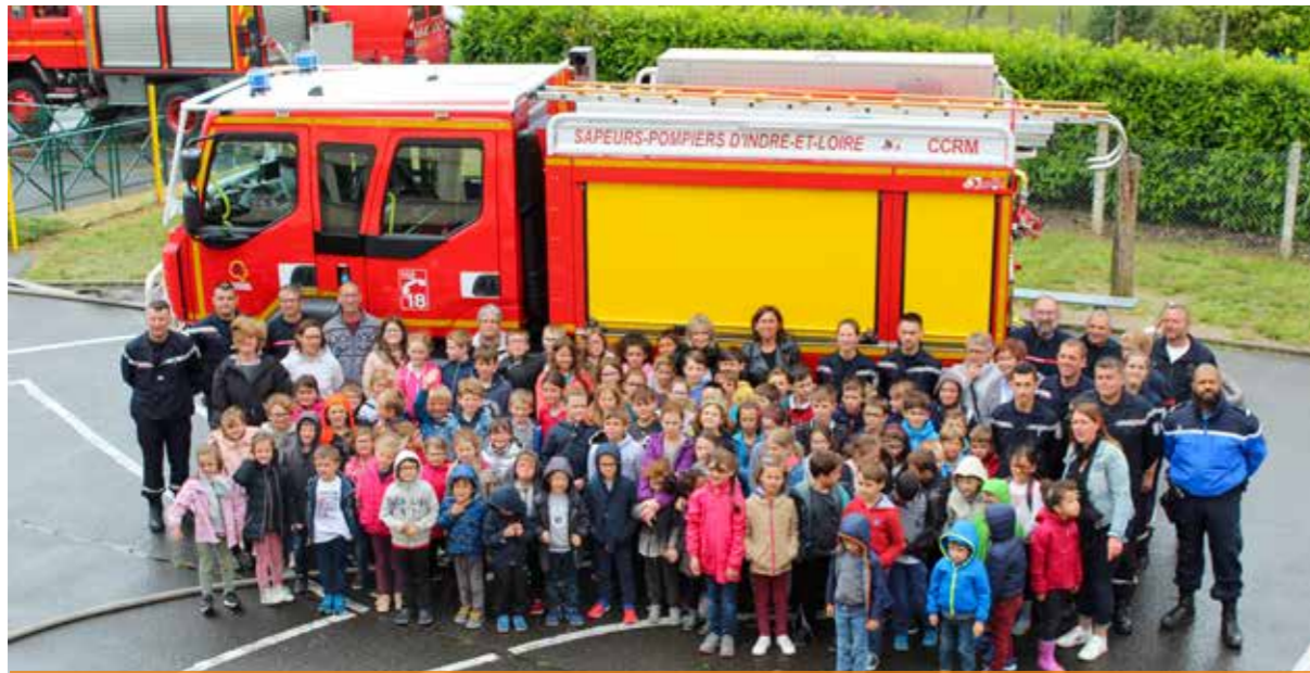
Journée avec les Pompiers du Lathan à l'école.

Nous œuvrons, chaque année, pour participer au financement des projets de l'école primaire Joseph Joffo, mais également à la vie de notre village. Pour ce faire tout au long de l'année scolaire, nous organisons divers