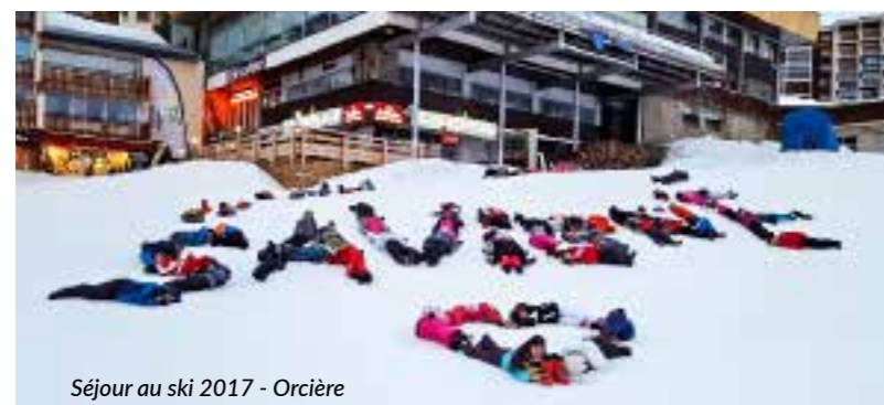
Séjour au ski 2017 - Orcière

Toutes les conditions sont donc réunies pour permettre aux élèves de construire un parcours de réussite qui doit leur permettre d'obtenir leur Diplôme National du Brevet et préparer leur orientation à l'issue du collège.