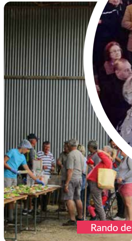
Rando des Pompiers