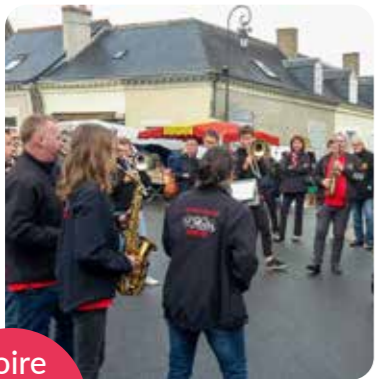
Foire de la Ste-Fleur