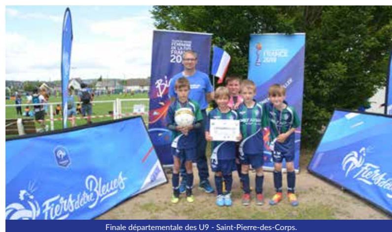
Finale départementale des U9 - Saint-Pierre-des-Corps.

Les dirigeants et les joueurs vous présentent leurs meilleurs vœux pour cette année 2020.