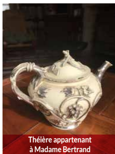
Théière appartenant à Madame Bertrand

Bien plus récemment, en Touraine, l'homme a utilisé cette argile pour en faire des briques mais aussi les tuiles de certaines de nos toitures tourangelles et les célèbres « Faïences de Langeais ». Actuellement, des carreaux de cuisine sont encore confectionnés, d'une façon artisanale, dans l'Atelier Caballero au cœur d'un petit village de La Rouchouze.