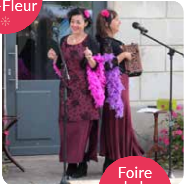
Foire de la Ste-Fleur