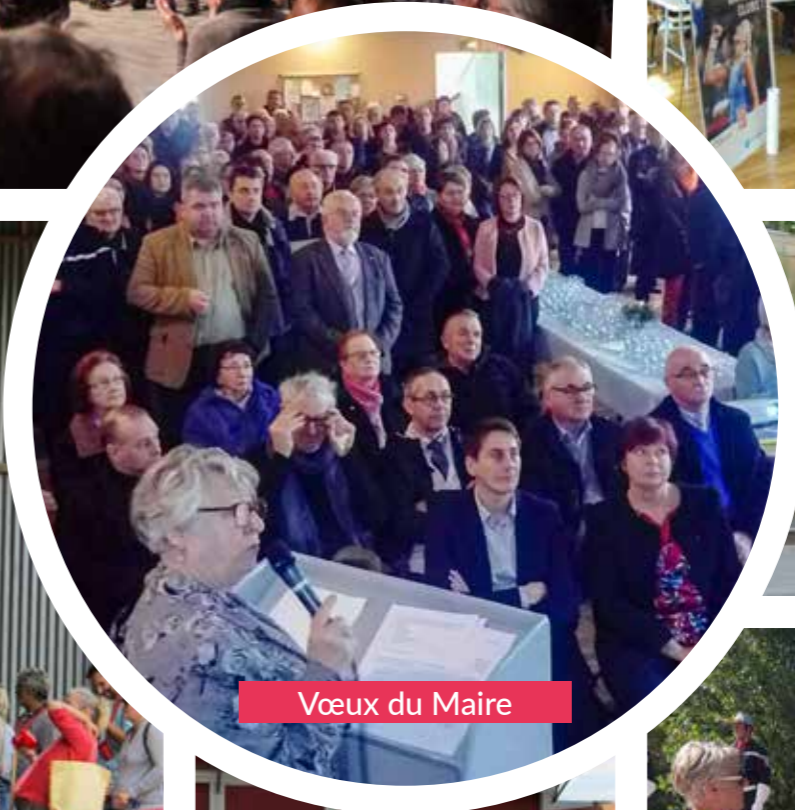
Vœux du Maire