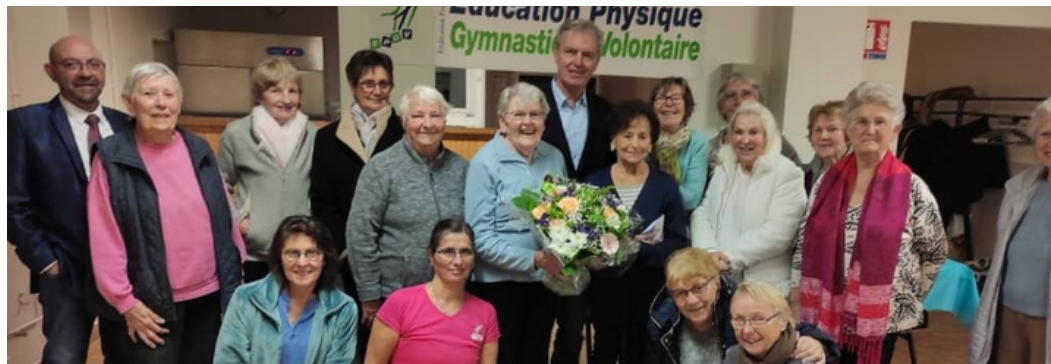
Photo prise le 23 novembre 2022 à l'occasion de la célébration des 40 ans de l'association.

Forte de nos 40 ans d'existence dans la commune de Savigné-sur-Lathan, venez nous rejoindre pour garder la forme à notre cours de gymnastique d'entretien suivi du cours de gymnastique douce et de détente.