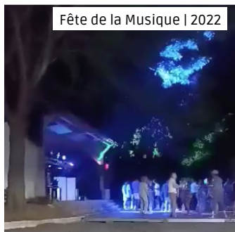
Fête de la Musique | 2022