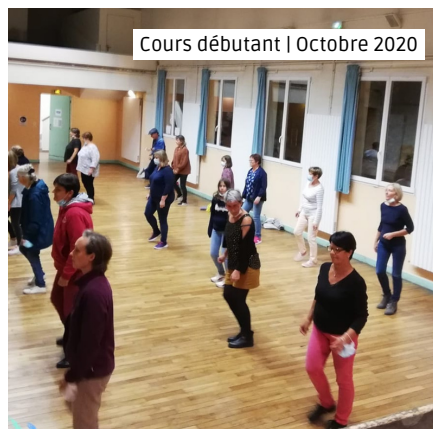
Cours débutant | Octobre 2020