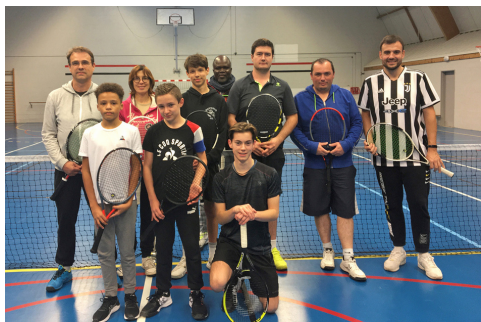
Entraînement au gymnase

Une sortie à l'Open Engie de Touraine a été organisée pour les enfants, ce fut l'occasion pour eux de voir évoluer des joueuses professionnelles dans le cadre d'un tournoi international et de participer à des activités ludiques mises en place lors de cette compétition. De beaux souvenirs pour eux lors de cette journée qui sera renouvelée en 2023.