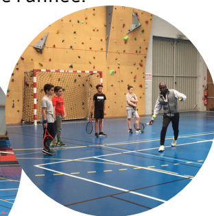
École de tennis de Savigné

En plus des entraînements hebdomadaires, l'ACTSG composée aujourd'hui de 35 joueurs de 6 à 69 ans, propose tout au long de l'année des animations variées autour du tennis. Durant la saison 2021/2022, les joueurs ont pu mesurer leur niveau dans plusieurs tournois et se perfectionner durant notre stage de printemps pour les plus jeunes du club.