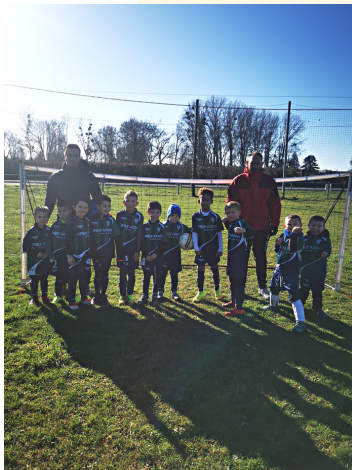
Équipe des U7