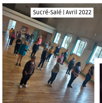
Sucre-Salé | Avril 2022