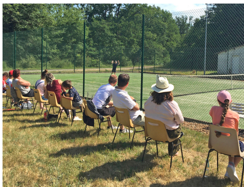
Tournoi de la Fête du Tennis

Enfin, l'ACTSG organise tous les ans en juin sa fête du tennis avec matches, pique-nique, tombola, remise des diplômes et médailles pour les jeunes... Une journée durant laquelle tous les adhérents se retrouvent autour de leur sport favori dans la bonne humeur avant la pause estivale.