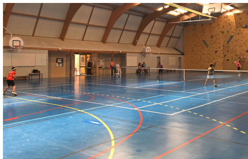
Tournoi de doubles