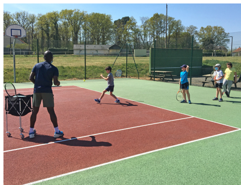
Stage de perfectionnement

En plus des entraînements hebdomadaires, l'ACTSG composée aujourd'hui de 35 joueurs de 6 à 69 ans, propose tout au long de l'année des animations variées autour du tennis. Durant la saison 2021/2022, les joueurs ont pu mesurer leur niveau dans plusieurs tournois et se perfectionner durant notre stage de printemps pour les plus jeunes du club.