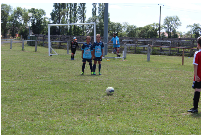
Équipe des U11 et les éducateurs

Remise des maillots avec les U11 en la présence de nos sponsors et de la Municipalité