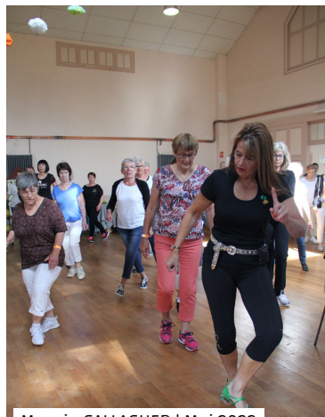
Maggie GALLAGHER | Mai 2022

En mai 2022, nous avons même organisé notre 1er évènement 100% line. Nous avons reçu Maggie Gallagher, chorégraphe anglaise / irlandaise, de nombreuses fois récompensée par ses pairs qui, à ce jour, a écrit plus de 400 chorégraphies, danses country et line confondues. Près de 90 danseurs venus de toute la France nous ont rejoints pour une journée exceptionnelle de stage clôturée par un bal line. Un 1er évènement qui a connu un grand succès et qui a permis à l'association et à « Flo » de faire découvrir à ses adhérents l'ambiance des rassemblements line comme nous pouvons en vivre dans d'autres clubs en France.