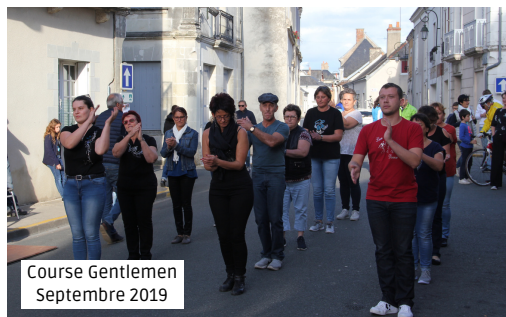
Course Gentlemen Septembre 2019