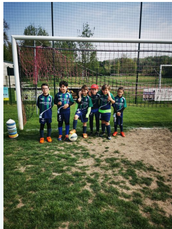
Équipe des U9

Renseignements auprès de Frédéric GOUTARD au 06 79 18 41 32